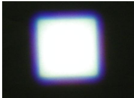
角型アパーチャー