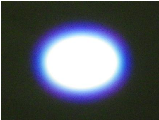
楕円型アパーチャー

内部のアパーチャー（絞り）の形状を変更する事により、様々な形状のスポット光を投射することが可能です。